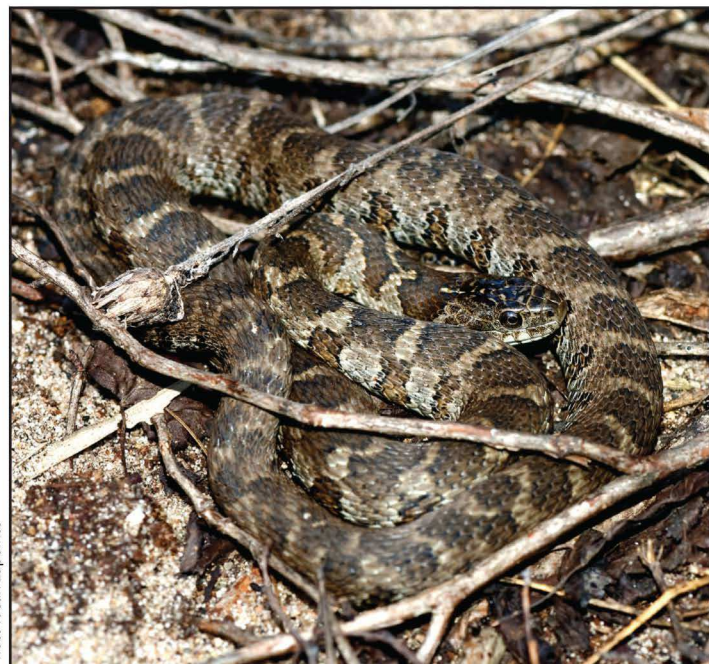
La couleuvre d'eau peut atteindre une longueur de 1,5 mètre

La couleuvre d'eau, espèce au corps massif, peut atteindre une longueur vénérable de 1,5 m. Sa coloration varie du gris pâle au brun foncé, avec des bandes transversales et des taches allant du roux au noir. Ces motifs s'estompent avec l'âge, et les plus vieux spécimens deviennent complètement bruns ou noirs. La couleuvre d'eau peut se trouver dans une grande variété de milieux aquatiques, du moment qu'elle y trouve des proies en abondance et des abris. Elle se nourrit surtout de poissons. L'espèce est diurne lorsque les températures sont plus fraîches, soit au printemps et à l'automne, et devient plutôt nocturne en été. La couleuvre d'eau passe une grande partie de son temps à se chauffer au soleil sur une rive ou sur les branches surplombant l'eau.