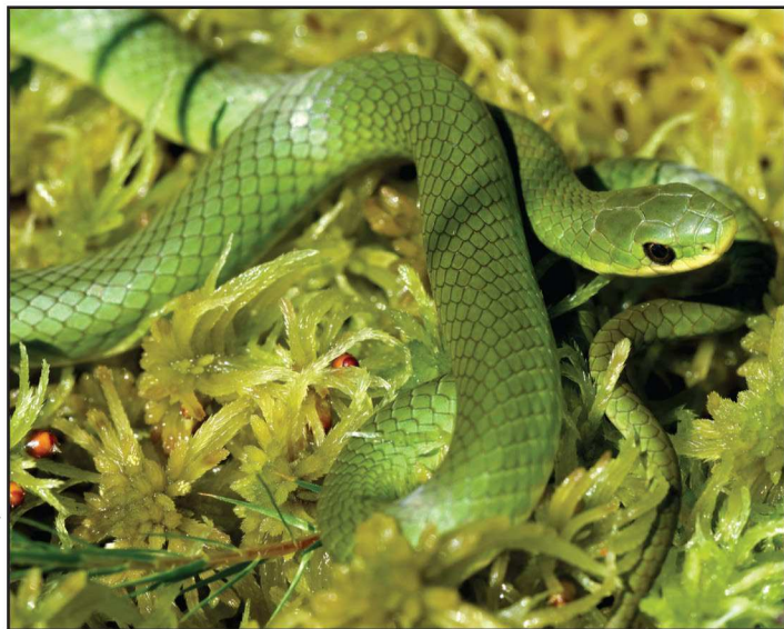
La couleuvre verte est plus répandue qu'on pourrait le croire

Rapportée une dizaine de fois en Abitibi-Témiscamingue, la couleuvre verte est probablement plus abondante et répandue que le nombre d'observations le laisse croire. Une mention anecdotique porte à croire qu'elle pourrait se trouver aussi au nord qu'en Abitibi-Ouest. Sa coloration vert clair ou vert feuille lui confère un bon camouflage. Elle peut donc être difficile à déceler. Cette espèce des milieux ouverts passe le plus clair de son temps cachée sous un abri. Elle adopte volontiers les abris artificiels comme les planches, les bardeaux et la tôle.