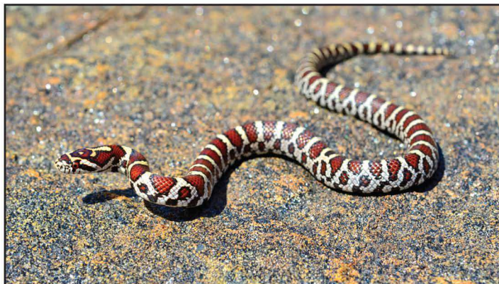
La couleuvre tachetée est le seul serpent constricteur du Québec

rangées de taches irrégulières brunes ou rouges, cerclées de noir. Elle a habituellement une tache pâle sur la tête en forme de V, de Y ou de fer-de-lance. Elle peut se trouver dans une large gamme d'habitats, des forêts feuillues et pinèdes, jusqu'aux champs broussailleux et collines rocheuses. La couleuvre tachetée s'abrite sous les pierres et les troncs et utilise volontiers les abris artificiels. Il est intéressant de noter que cette espèce, qui étouffe ses proies avant de les manger, est le seul serpent constricteur du Québec.