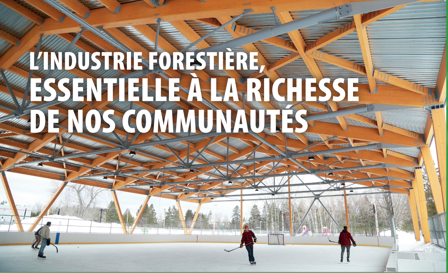
Patinoire à Saint-Alexandre-de-Kamouraska